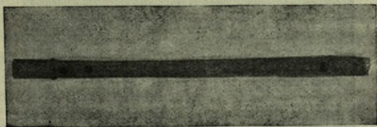
Parte posterior del instrumento con el agujero destinado al dedo pulgar.

Jamás en el baile oí son que más bullese el pie, que tal placer me causase cuando el tamboril sonase, por más que el tamborilero chillase con el garguero y con el palo tocase.