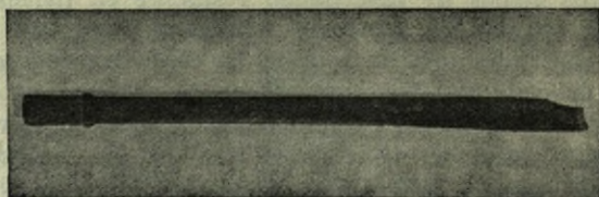
Parte anterior del instrumento con los agujeros destinados a los dedos índice medio.

El hallazgo que motiva este trabajo viene a confirmar lo expuesto.