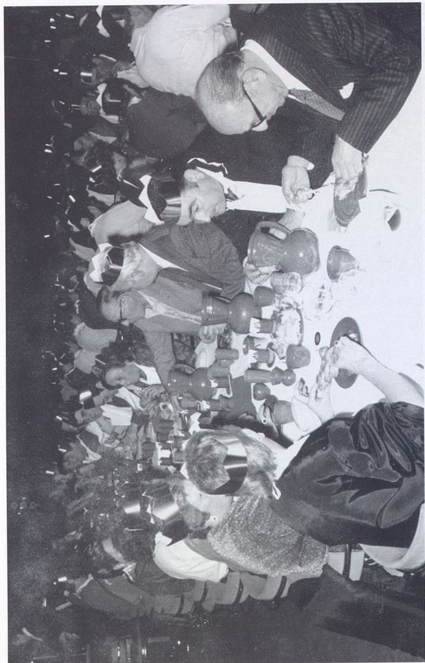
1972.- Cena medieval organizada en la sala de fiestas.