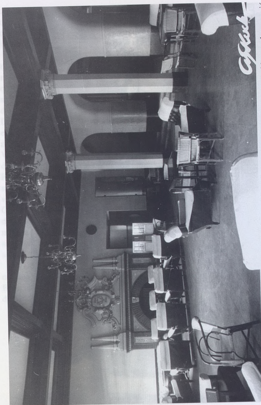
1941.- Sal6n de tertulias, con la chimenea construida bajo la direcci6n del artista Obdulio Lz. de Uralde, que desapareci6 con las obras de 1964.