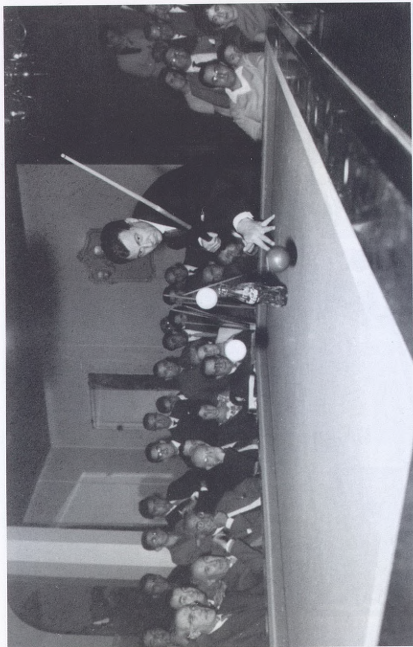
1960.- Exhibición en la sala de billares.