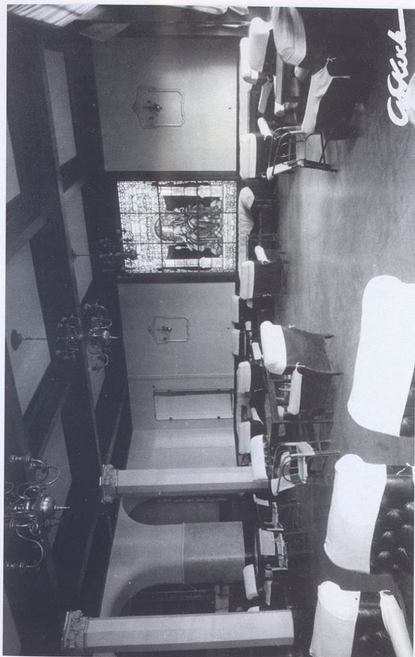
1941.- Salón de tertulias con la vidriera coloreada suprimida por obras posteriores.