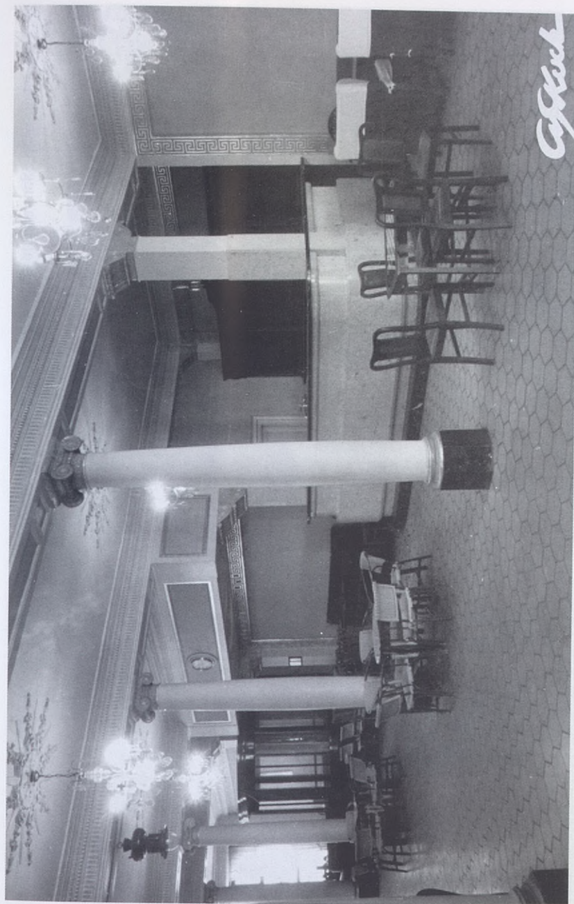
1941.- Bar situado en los locales de Dato 6, que apenas tuvo aceptación y dejó de usarse. Fue luego suprimido.