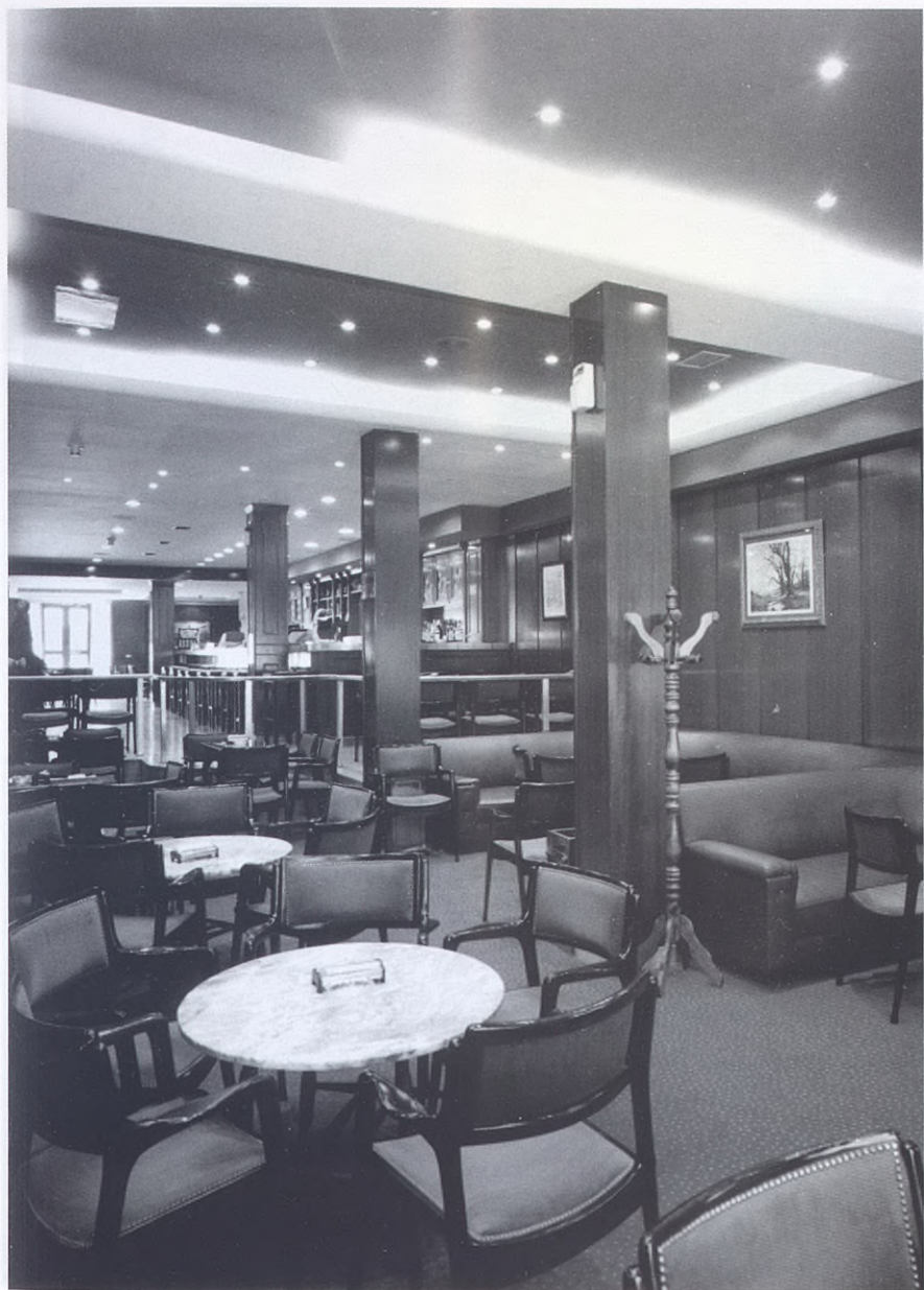
2001.- Cafetería del Círculo. Estado actual.