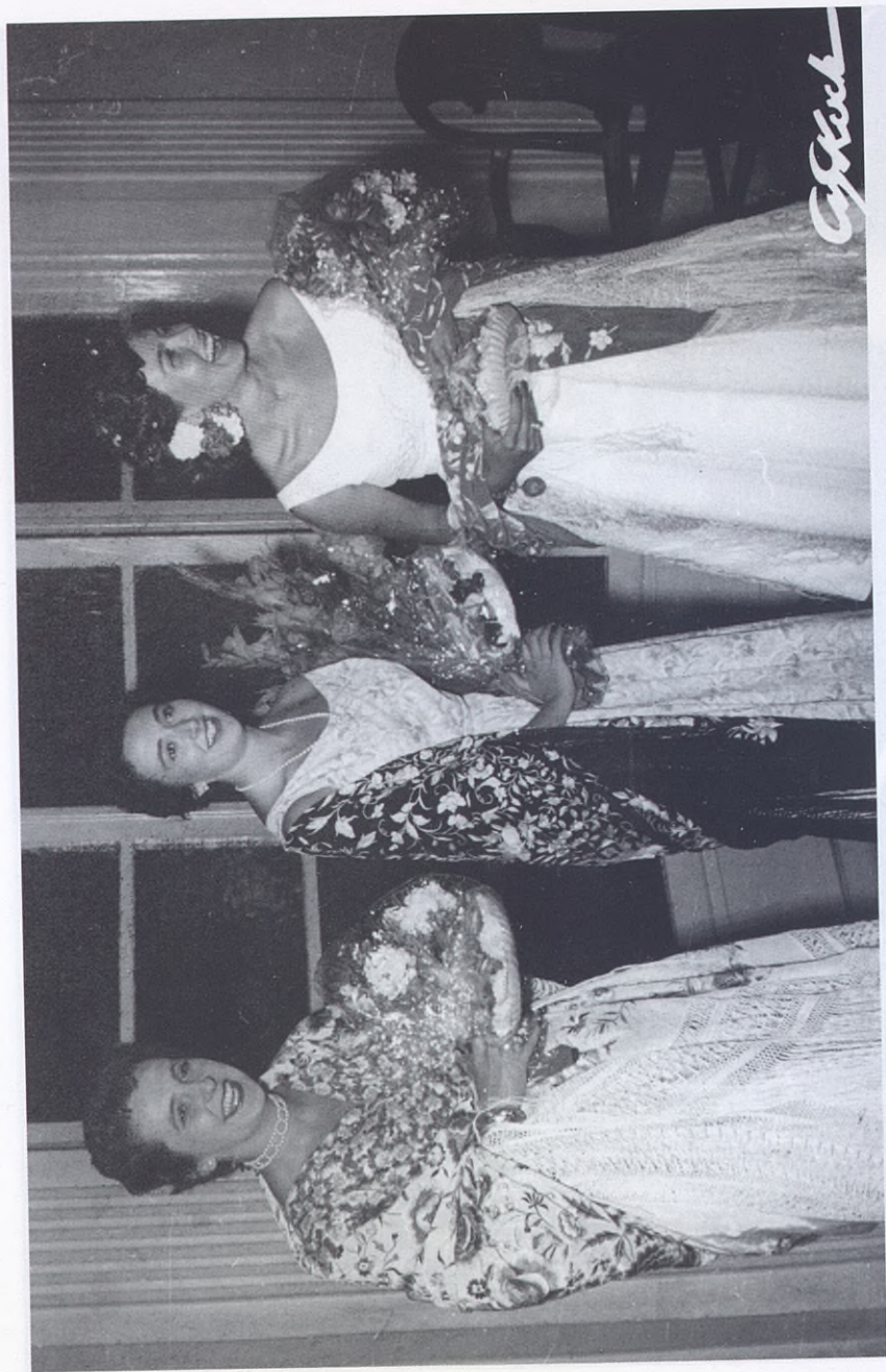
1955.- Verbena del mantón, con la reina de la fiesta y sus damas de honor.