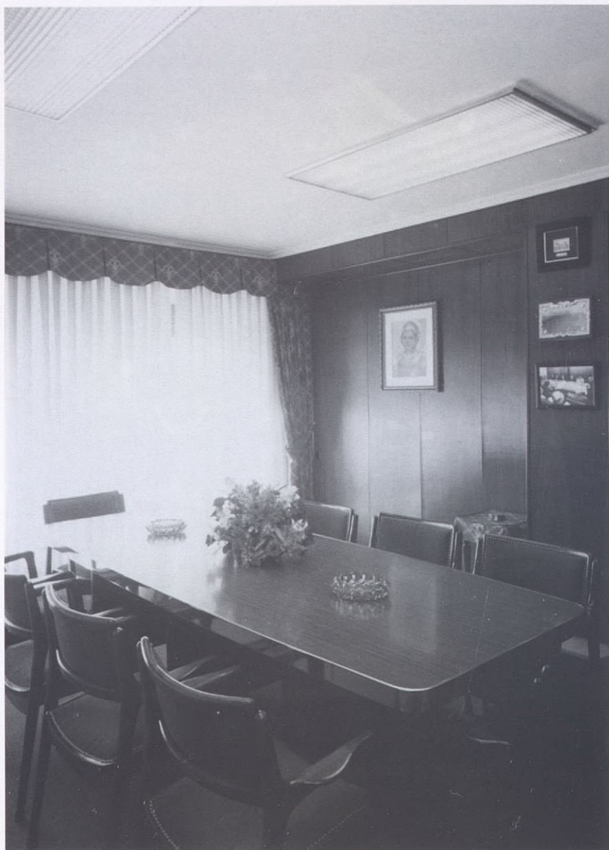
2001.- Sala de juntas del Círculo Vitoriano.