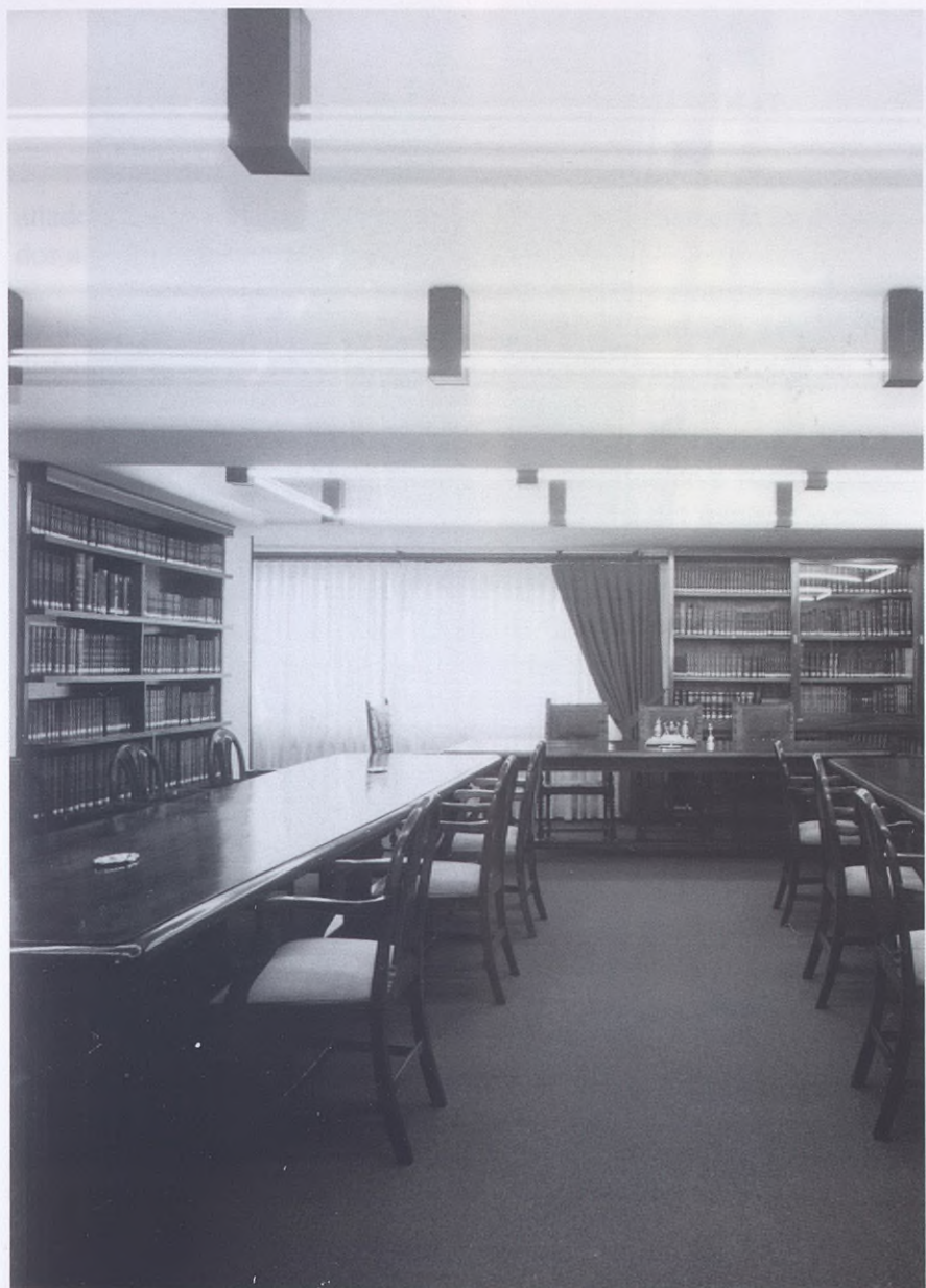
2001.- Biblioteca y salón de consejos.