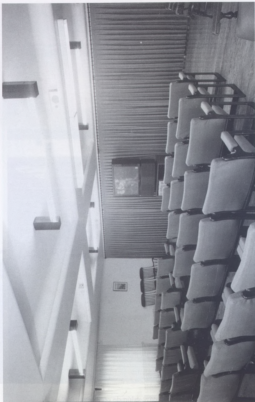
2001.- Sala de actos del Círculo.