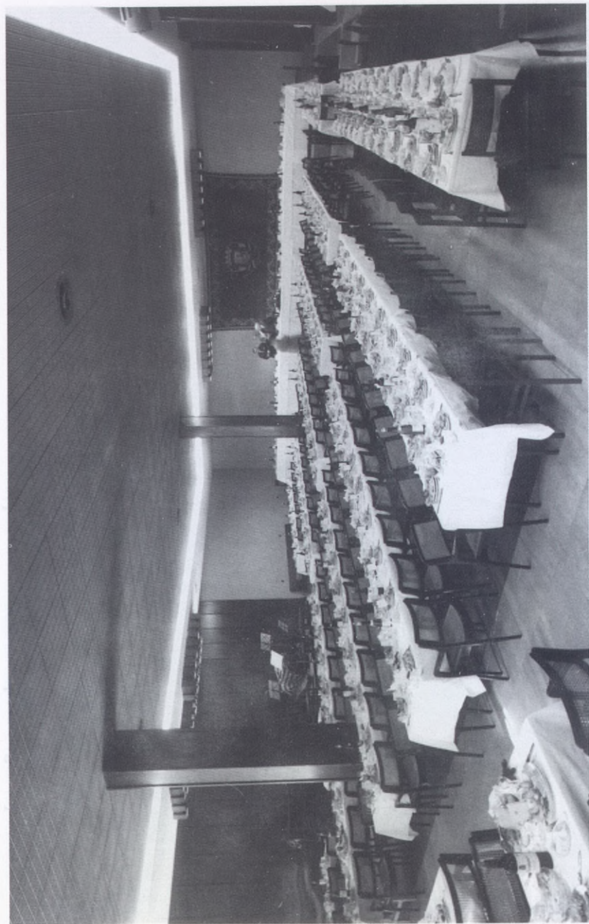
1968.- Sala de fiestas preparada para el banquete servido por la Caja Provincial de Ahorros de Alava en sus Bodas de Oro.