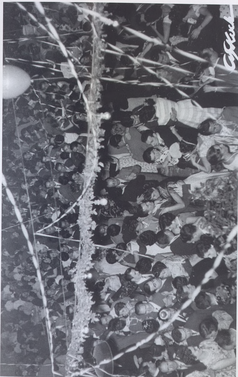
1955.- Aspecto del patio-jardín del Círculo, en las fiestas de la Blanca.