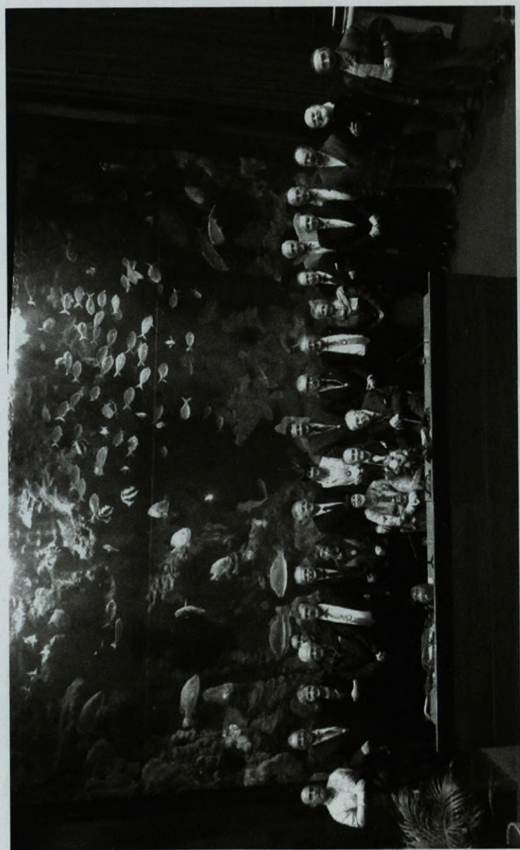
Amigos de Número y Supernumerarios de la RSBAP.