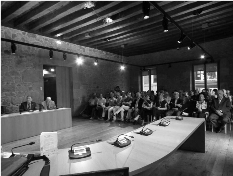
UDALEKO ARETO NAGUSIA (Tolosa)