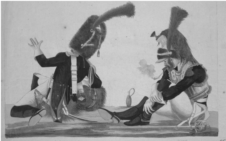
Soldado y granadero de la guardia imperial sentados.