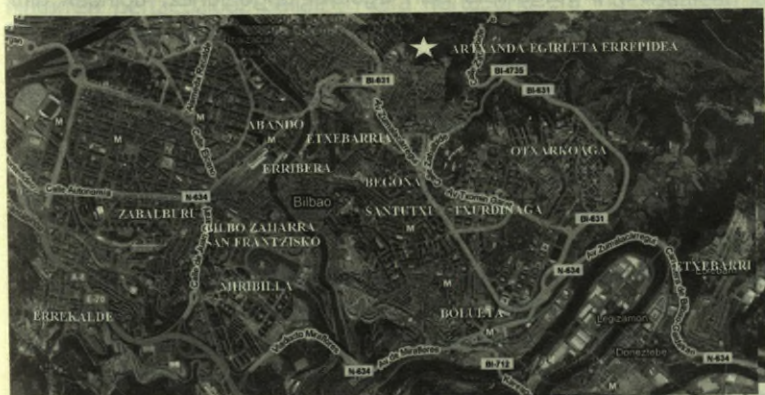
12. irudia. Bilboko auzoak

bere nortasuna hiltzen ari den hiriak itzultzera behartzen du, ezinbestean, eskaintzen dion babes basatian gorde dadin.