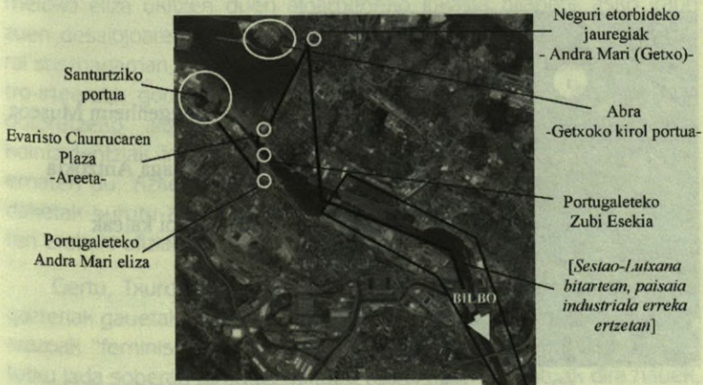
9. irudia. Bilbotik kanpoko ibilbide

Bizilagunek jarrera bitxia hartzen dute hiria berregituraketak utzitako hutsune hauen aurrean, tristezia eta nostalgjaren artean mugituz. "Bilboko metro berria hiritik irten eta Bilbo Handia deitzen dioten herrietatik dabilenean erreka ertzetik, gehienek paisaia negargarria, kutsadura eta anabasa baino ez dituzte ikusten itsasontzi, unziola, enpresa kimiko eta industria ohien orubeetan. Erromantikoeak, nostalgikoeak eta komunistek zirrara berezia sentitzen dute irudi horren aurrean. Ez dakite argi zer egin mola, kanal, garabi, tximinia eta bestelako aurriekin, baina borroka partikularrari eusteko arrazoi bat gehiago ematen diete aldioro" (82. or.). Aurrien artean, modu aiposean begiztatuz gero, dekadentziak gordetzen duen balio estetikoa deskubritu daiteke. Hori ez bada, etsipen-sentimenduak gora egiten du hiritarrak birmoldaketak ezabatutakoa gogoratzean. "Orain nekez ikusiko du Deustuan zein Otxarkoaga gainean txakolinik, eta Egirletara doan autobia lerro finetik baserria kokatzen saiatu da" (84. or.). Esfortzu guztiak alferrik baina. Batzuk hondamendi bihurtu zutena aparatasuren bilakatzeko garaia omen da hau.