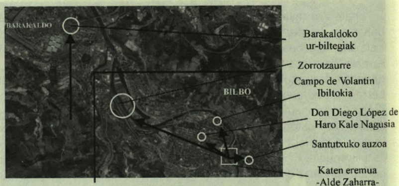
5. irudia. Katen eremutik kanpoko mugimenduak

sartu nintzen. Inor ere ez. Graffitiak hormetan. Txakurren zaunkak bizil-bizikiak urrunean. Auzo fantasmagorikoa, beldurgarria, hutsa. Inor ere ez. Bertan arimarik biziko ez balitz bezala, etxeetan ere arimarik ez balego bezala" (133. or.).