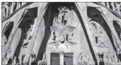
Josep María Subirachs. Fachada Sagrada Familia. 1986-2009.