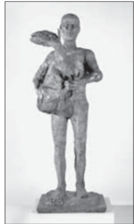
Pablo Picasso. El Hombre del cordero. 1943.