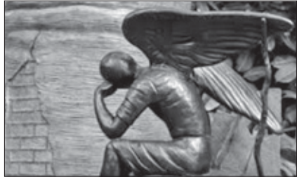
Dalí. Ángel, S.f.