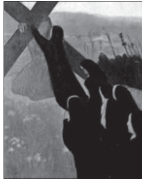
Maurice Denis. Camino del Calvario. 1889.

12. Maurice Denis (Granville, 1870-Paris, 1943): Camino del Calvario, 1889 / Ofertorio en el Calvario, 1890 / Natividad / Virgen con niño / Adoración de los Reyes, 1904 / Anunciación, 1912 / Piedad / Descendimiento / Paraíso.