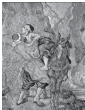
Van Gogh. El Buen Samaritano. 1891.