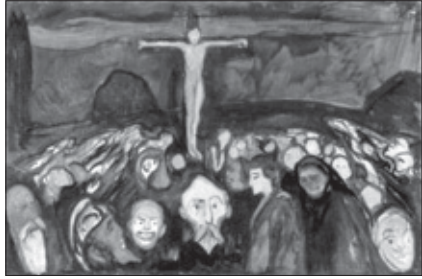
Eduard Munch. Gólgota. 1900.

7. Eduard Munch (Adalsbruk, Noruega, 1863-Oslo, 1944): Gólgota, 1900 / Camino de Emaus.