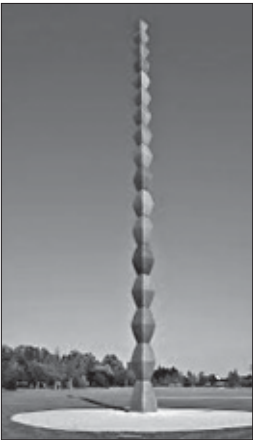
Brancusi. La columna infinita. 1933.