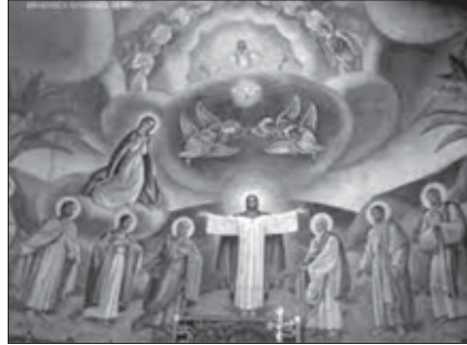
Aurelio Arteta. Mural Seminario de Logroño. 1929.