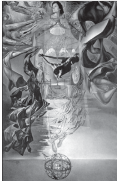
Salvador Dalí. Assumpta corpuscalaria lapizlazulina. 1952.