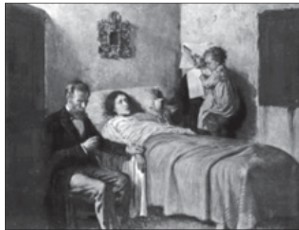
Pablo Picasso. Ciencia y Caridad. 1897.