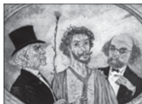
James Ensor. Ecce Homo. 1891.