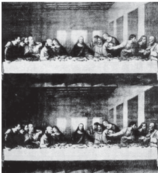
Andy Warhol. La Última cena. 1986.