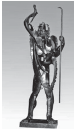
Gargallo. El Profeta. 1933.