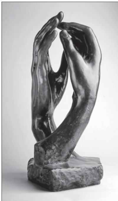
Auguste Rodin. La Catedral. 1908.