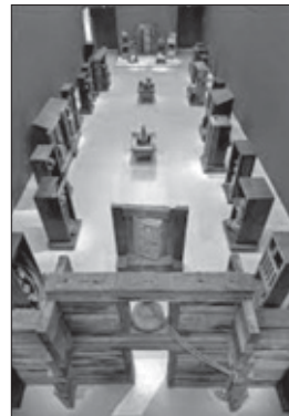
Anthony Caro. El Juicio Final. C. 1990.