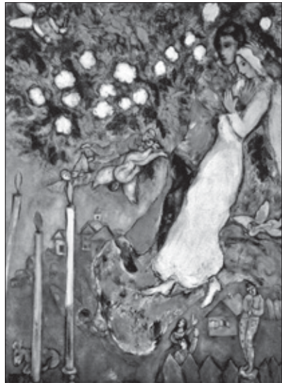
Marc Chagall. Las tres velas. 1940.