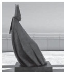
Manzú. Cardenal sentado 1975-1977.