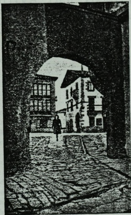
Arco de las antiguas murallas de Plencia. Al fondo la transformada Torre de Butrón, de Plencia.

Como ha quedado consignado al principio de este artículo, ha sido ocasión de que se escriba el reciente fallecimiento del Duque del Infantado, Marqués de Valmediano, amigo de los AMIGOS, que uno de éstos ha querido recordar como representante de la primogenitura de las casas de Basurto de Abando, Butrón de Plencia y Echevarría de Urdúliz, que su padre las cedió a su hermana, Marquesa de Torrecilla, Señora del Castillo de Butrón, lo que dió lugar a que se unieran al tronco originario los bienes de una rama menor de los Butrón, con Solares en Plencia y Urdúliz, y los de la que un día fué poderosa Casa de Basurto, cuya Torre se levantaba hasta los últimos días del siglo diecinueve en el lugar que hoy ocupa la Capilla del Santo Hospital Civil, cabe la también desaparecida ermita de Santa Ana, en la que se celebraba tradicional romería.