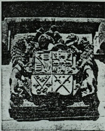
Armas de la Torre de Butrón, de Plencia

Muxica a dentelladas con los enemigos Butrón como es, todos lo saben Vencedor estoy (o soy) Pueblo estate en guarda.