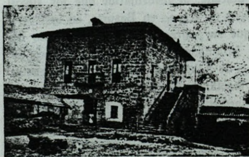
Casa llamada Torrebarri o Torre de Echevarria, en Urdúliz.

De no seguir la senda en la que me situó el Duque del Infantado, difícilmente hubiera determinado esta Torre Nueva, de Urdúliz, como la Torre de Echevarría de los Valmediano, ya que era lógico suponer que, ostentando los buitrones y dada su proximidad al Castillo butrónida, fuera una avanzada o atalaya dependiente de éste, y que la hubiera heredado Torrecilla juntamente con el Castillo de sus mayores.