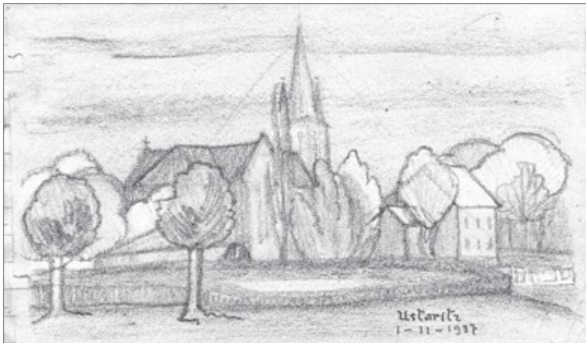
Ustaritz. 1937. Iglesia y árboles.

El año 1932, y del 15 de mayo al 15 de junio, se celebró en Bilbao y en el Museo de Bellas Artes, dirigido por Aurelio Arteta, la 2. a Exposición de Artistas Vascongados en la que tomó parte Pablo Zabalo en el apartado de Pintura con dos obras, las números 85 y 86, tituladas: Iglesia de Mezquia, y, Casas de Segura. Junto a él tomaron parte artistas reconocidos como Aranoa, Arrúes, Basiano, Cabanas Erauskin, Gal, Martiarena, Montes Iturrioz, Olasagasti, Sarriegui, Tellaeche, Urrutia, Zubiaurre, y muchos otros artistas jóvenes, habiéndose producido protestas entre los artistas noveles eliminados (9).