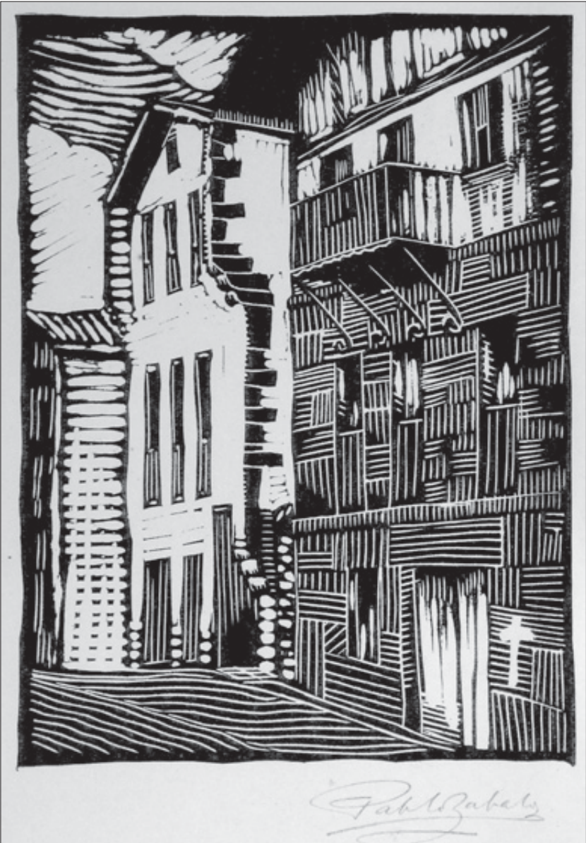
Grabado de Pablo Zabaló.