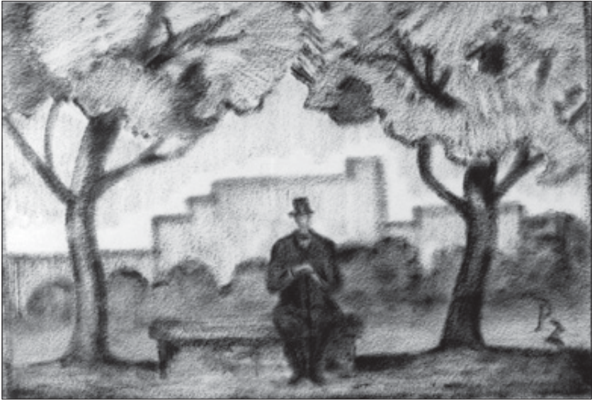
Caballero sentado en un banco.

Dibujos de casas y plantas de los diversos territorios del País Vasco, norte y sur, así como forjas de balcones, casas señoriales, ayuntamientos, puertas y arcos de villas, puentes, iglesias y ermitas, cementerios, estelas y argizaiolas, un total de 76 piezas, son captadas en su mayoría con pura línea, otras tendiendo más a la acumulación de trazos que recuerdan a grabados, algo que se estilaba mucho en las ilustraciones de la época, y que fueron recopiladas en 1945 por el mismo Pablo en Santiago de Chile, y editadas junto con la Grafía Vasca de su hermano Jhon, en la obra Arquitectura popular y Grafía Vasca , editada por la editorial Ekin de Buenos Aires en 1947 (12).