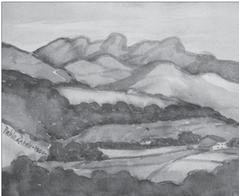
Peñas de Aya. 1960.