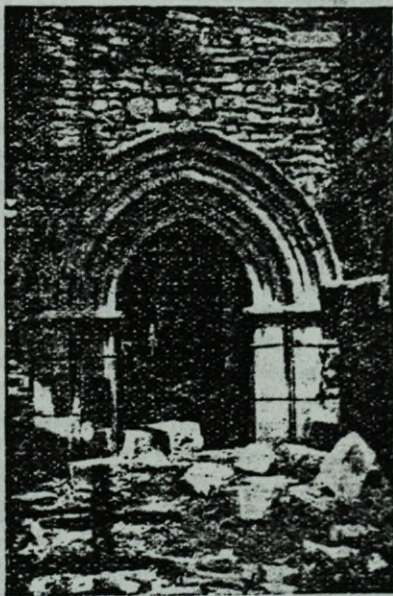
‘Puerta apuntada de la Ermita de San Sebastián de Colisa :’

Después de la fiesta religiosa y de la romería tradicional en Colisa, el día de San Roque, se corrían unos novillos en Pandozales, y en relación con el Coso allí construido y sus sucesivas modificaciones, escribe extensamente Heros en su referido trabajo. Al prohibirse como desmoralizadores el baile y las romerías, en el país vascongado, lo que dió lugar a que desaparecieran muchas ermitas, sufrió un rudo golpe lo tradicional en torno a Colisa. Lo recuerda Heros al decir: “Informado nuestro Prelado desde el año de 1790 de que el Tamborilero subía al encumbrado pico de Colisa en el día de San Roque, y de que los devotos después de oír misa