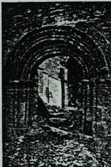
Puerta románica de la Ermita de San Sebastián de Colisa