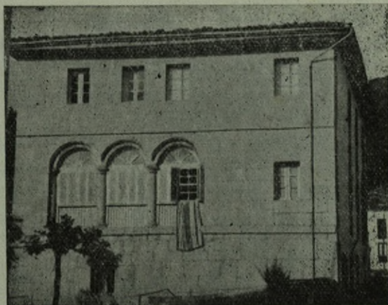
Alzola.—Solarea de la casa sobre el río.