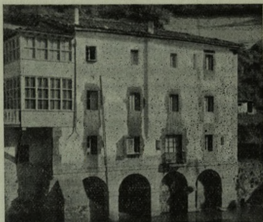
Alzola.—Casa sobre el río.

mos el nombre del autor: Lucas de Longa (2). Ha sido fácil su localización por estar sobre el río Deva “con sus portales, unos sobre arcos y otros sobre pilares”. Tuvo, según Llaguno, “capaces almacesnes” para guardar las mercancías que subiendo el curso del Deva, vinieran de la costa” (3). Pero no era necesario este detalle de las arcadas sobre el río para asignar su trazado, a Longa. Basta examinar la solana, para comprender que fué la misma mano la que delineara sus delicadas molduras y las que aparecen en la galería de “Solartecua” o casa-solar de Mugartegui en Marquina, apoyadas en dos bien perfiladas columnas clásicas. Y, de ésta, sabemos documentalmente que su autor fué el arquitecto de Mendaro, Lucas de Longa y Zuazu.