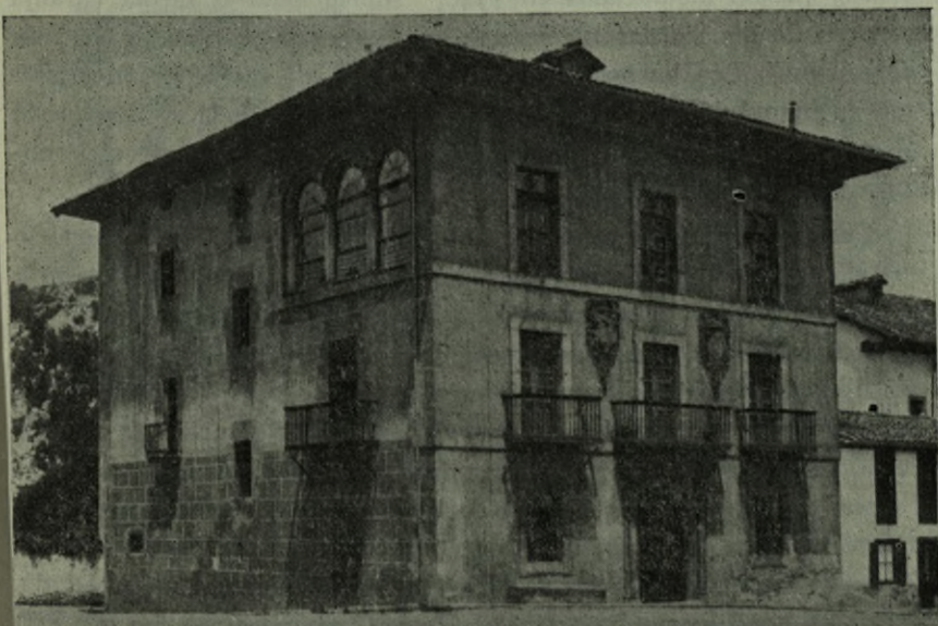
Marquina.—Casa de Mugartegui.

En aquella época misma, 1681 (10), se hizo la escritura de reedificación de la iglesia de San Andrés de Echeverría, en Marquina. Se comprometió a hacer las obras el maestro Martín Lexardi, bajo el plano o traza hecho por Lucas de Longa. Y en 1686 firmaron otro documento para hacer las bóvedas de la arquilla principal del altar mayor y reforzar los estribos, trasladar el campanario y hacer la calzada desde el altar mayor hasta la puerta lateral. Costó toda la obra 57.959 reales (11).