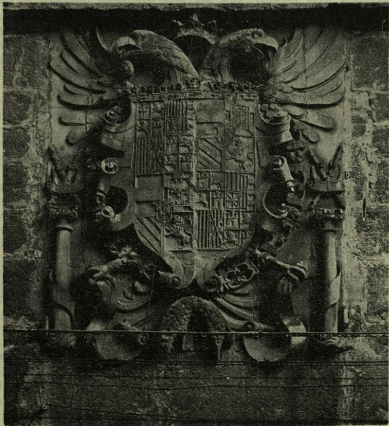
Escudo imperial que luce la fachada de la casa solar de ONDARZA en Vergara.