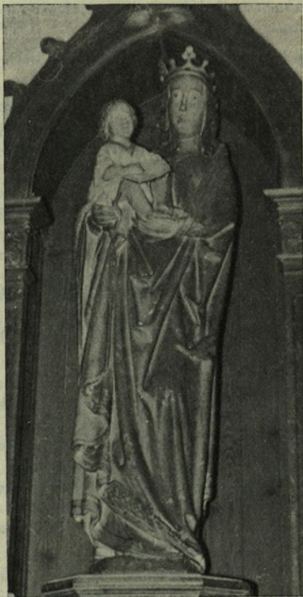
Virgen del siglo XV de Aguinaga de Eibar