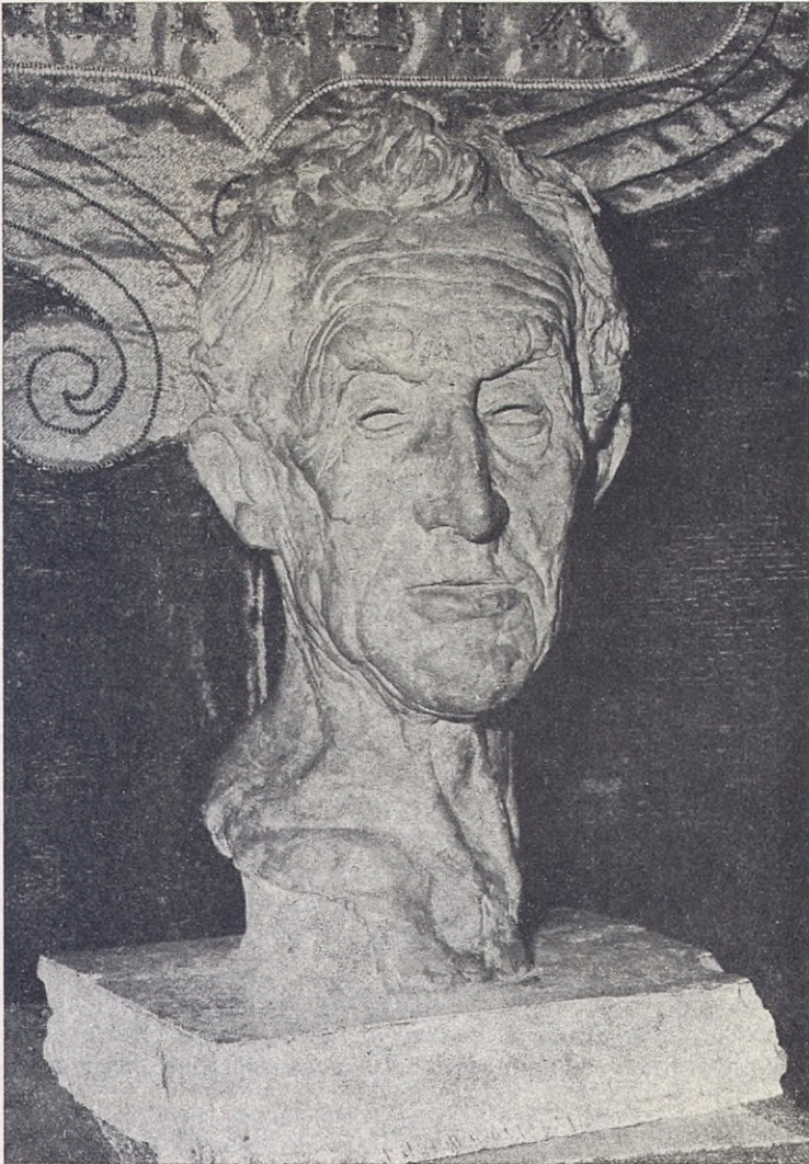
Busto de Ravel, de Ignacio Zuloaga, que presidió la Exposición de Recuerdos, en San Sebastián