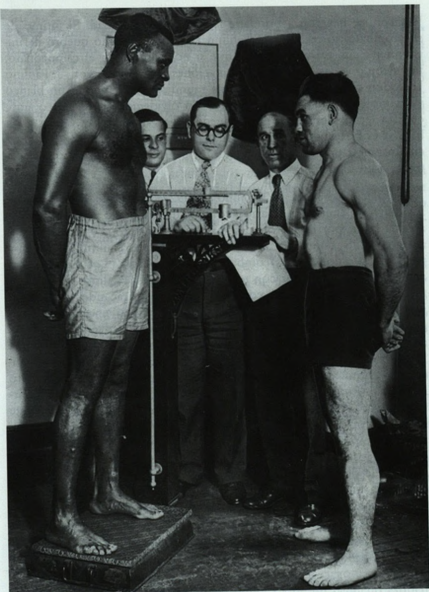
El 13 de julio de 1927 Paulino Uzkudun combate en New York contra Harry Wills ("La Pantera Negra"). En el cuarto asalto noquea a su rival. Obsérvese la diferencia de envergadura anatómica.