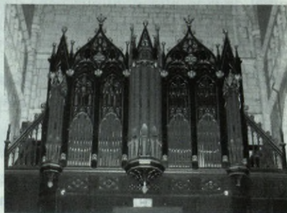
Vitoria: Catedral de Santa María. Casa Walcker. 1936

El inicio de la guerra en España durante el año 1936 hizo que el