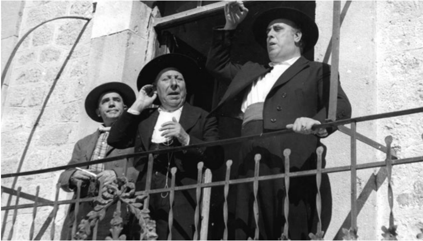
Discurso desde el balcón del ayuntamiento en Bienvenido Mister Marshall (1952)

No obstante, avanzada la secuencia hay un momento impagable en que el promotor y charlatán Manolo, al hablar al pueblo de Villar del Río de la llegada de los americanos del norte como si fueran los Reyes Magos, dice a los habitantes de la aldea: