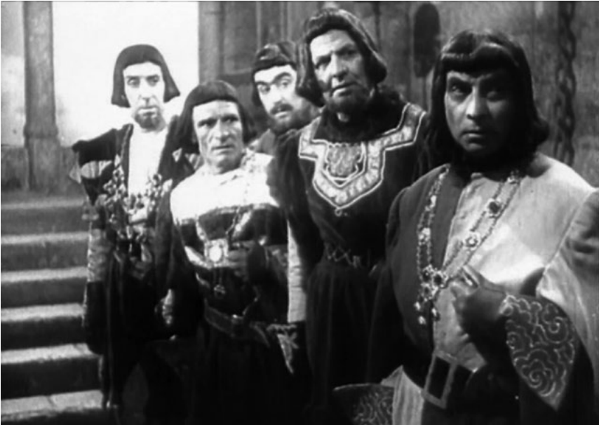
Secuencia inicial de Esa pareja feliz (1951)

El humor está presente en esta secuencia inicial del filme y la comicidad de la situación y el diálogo entre la reina y el dignatario se plantea como un partido de tenis: