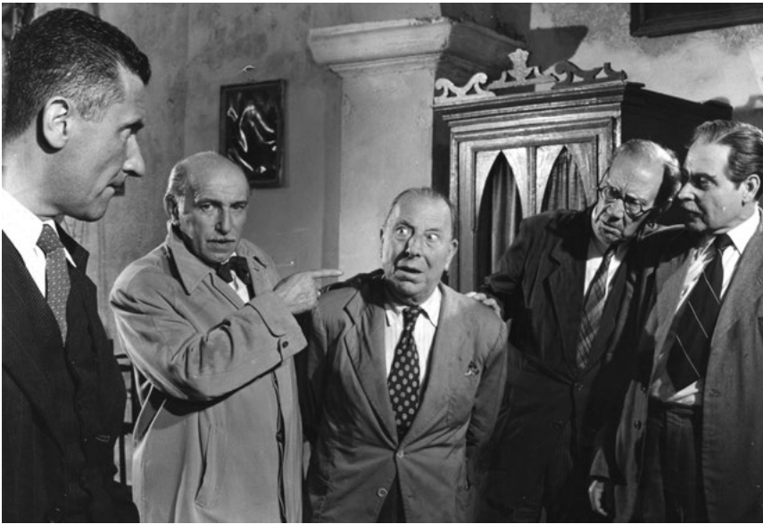
Las fuerzas vivas de Fontecilla en Los jueves milagro (1957)

esplendor perdido del pueblo atrayendo turismo. Los estafadores, personajes muy frecuentes en los filmes de Berlanga, montan un espectáculo de pirotecnia, luces y sonido que tendrá que convencer al pobre Mauro que no es otra cosa que una mente simple, un vagabundo, un pobre diablo. El parecido entre la talla de San Dimas que hay en la parroquia del pueblo y Don José, y por ende José Isbert, es francamente asombroso con lo cual el popular actor manchego es disfrazado con unas ropas y complementos más propios de un belén viviente que otra cosa. La peluca y la aureola que lleva el personaje son desternillantes y difíciles de describir.