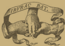
Mano, Señoría y Corona fidei