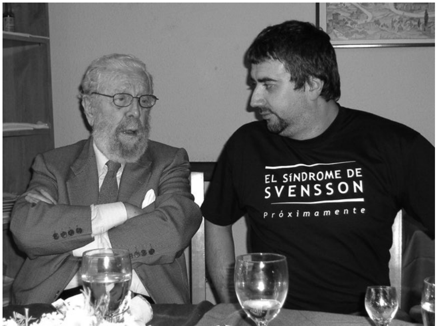
Berlanga y Kepa Sojo en Ourense 2005

España. El término berlanguiano solemos utilizarlo cuando se destapan casos de corrupción política, o cuando suceden acontecimientos tan absurdos con el de la Isla Perejil, o cuando se generan muchas situaciones provocadas por la pandemia mundial del Covid-19 y el confinamiento, así como cuando acaecen muchas situaciones que se producen en la España más profunda de siempre. Y es que Berlanga recoge el legado de la tradición literaria y artística española de todos los tiempos. En Berlanga hay mucho de Cervantes, de Quevedo, de Vallé-Inclán, de Arniches, de Machado, de Unamuno, de Ortega y Gasset, de Velázquez, de Goya, de Zuloaga, de Solana... En Berlanga hay mucho de todo y, además, casi todo es bueno.