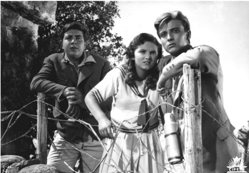
La pareja protagonista de Novio a la vista (1953)

- El imperio austrohúngaro se divide en imperio austriaco e imperio húngaro