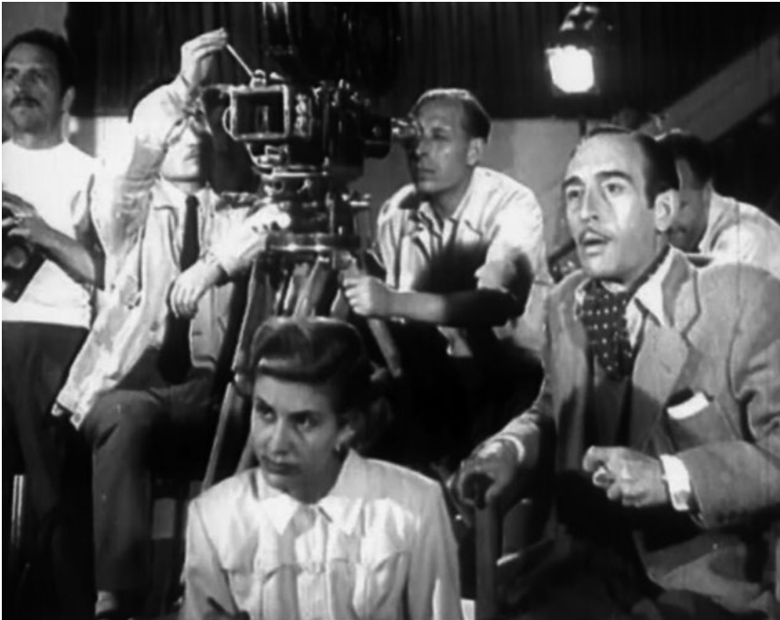
Esa pareja feliz (1951)

ficación social, desvelando la imposibilidad de superación individual existente dentro del empobrecido ambiente impuesto por la autárquica España oficialista de Franco. En la obra no había, tampoco, un retrato real de la España de la época. Simplemente, se trataba de presentar la otra cara del país, diferente a la aparecida en otras películas del período.