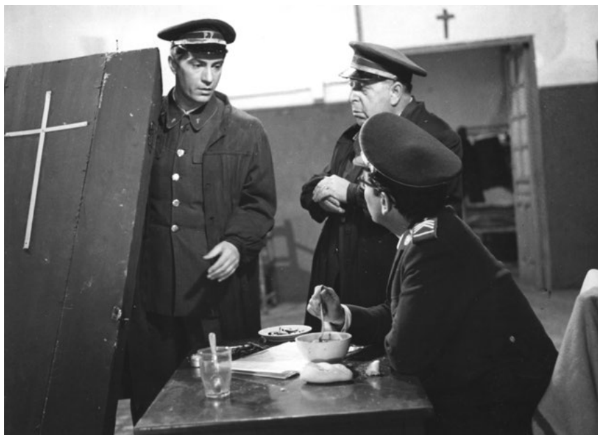
El verdugo (1963)

La crítica a la pena capital, desde una óptica esperpéntica, insertaba al protagonista atrapado por un sistema burocrático, en el cual, si quería acceder a un piso de protección oficial debía casarse con la hija de un verdugo, al provocar su embarazo, con todo lo que ello conllevaba. La visión de la muerte en la película es sarcástica. El personaje del verdugo joven, paradójicamente, es verdugo y víctima a la vez. Es víctima de la sociedad y de la burocracia franquista que lo va fagocitando hasta convertirlo, al tener que ejecutar finalmente, en otro resorte coercitivo del sistema. La resolución de la película, con los dos cortejos, el del reo y el del verdugo, que se van desmayando, ambos recorriendo una gran nave blanca para dirigirse al patíbulo, es una de las secuencias más brillantes y recordadas de la filmografía berlanguiana, así como del cine español de todos los tiempos.