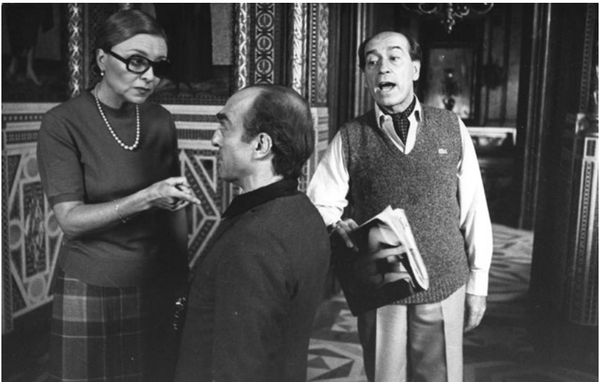
Patrimonio nacional (1980)

Segunda parte de la trilogía de los Leguineche. En este caso, tras la muerte de Franco, se muestran los problemas de adaptación de la nobleza española durante la transición a la democracia. En el título ya se veía, con evidencia, la intención por parte del productor, Alfredo Matas, de continuar con el éxito de su película anterior, y por ello, al repetirse la palabra “nacional” era más fácil para el espectador identificar ambos filmes. Si bien el éxito comercial de esta película fue inferior al de La escopeta nacional , ello no fue impedimento como para que se planteara realizar una tercera película sobre la peculiar familia noble.