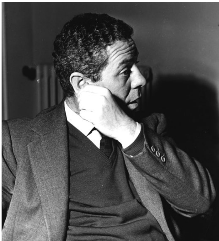
Luis García Berlanga a inicios de la década de los 50

Humor, una mención especial al guion y el premio de la crítica en la edición de 1953. Gracias al éxito de Bienvenido, Mister Marshall , se estrenó en agosto del mismo año, Esa pareja feliz , si bien este filme era de 1951. Si Bienvenido, Mister Marshall , fue concebida, en un principio por Bardem y Berlanga, fue al final Berlanga, quien acometió la dirección en solitario, produciéndose la ruptura entre ambos realizadores, que prosiguieron sus carreras en solitario. También en este año, Berlanga se incorporó a la plantilla de profesores del I.I.E.C., donde contó con alumnos como Carlos Saura. No obstante, el valenciano duró poco en el puesto docente por su consabida poca paciencia para la enseñanza.