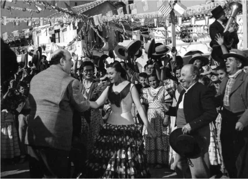
Bienvenido Mister Marshall (1952)

Además, la película cuenta con la secuencia más recordada del cine español, la del discurso del Ayuntamiento del alcalde sordo de Villar del Río (José Isbert) y el locuaz promotor (Manolo Morán) que analizaremos posteriormente en el apartado dedicado a las mejores secuencias del cine berlanguiano.