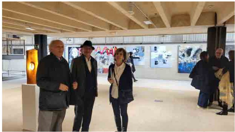
Primer Salón de Otoño de artistas Vasco-Navarros en el COAM. Madrid.