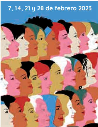
"Mujeres hacia el futuro" de Sonia Pulido

SALA DE CONFERENCIAS DE JUNTAS GENERALES DE BIZKAIA Hurtado Amézaga, 6. Bilbao