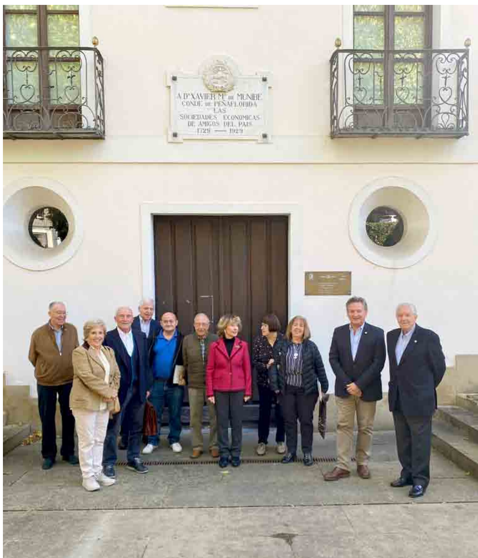
JUNTA DE GOBIERNO, el 21 de octubre de 2023, en el palacio de Intsausti, Azkoitia