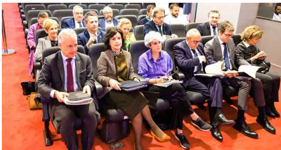
Reunión de "la Comisión Arco Atlántico de la Conferencia de Regiones Periféricas Marítimas"

En la reunión participaron la Rectora y Rectores de las Universidades del País Vasco, Eusko Ikaskuntza, Euskaltzaindia, Jakiunde y el Consejo Económico y Social vasco en toda su representación. (04.04.2023)