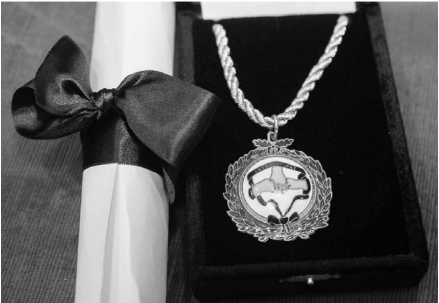
Acreditaciones: medalla y patente.