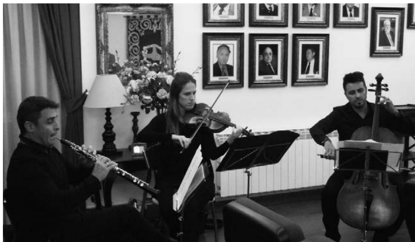
Un momento de la actual del Grupo musical.

Un año después de la derrota del ejército francés, en 1814, el consistorio, para celebrarlo, prepara un variado programa de fes-